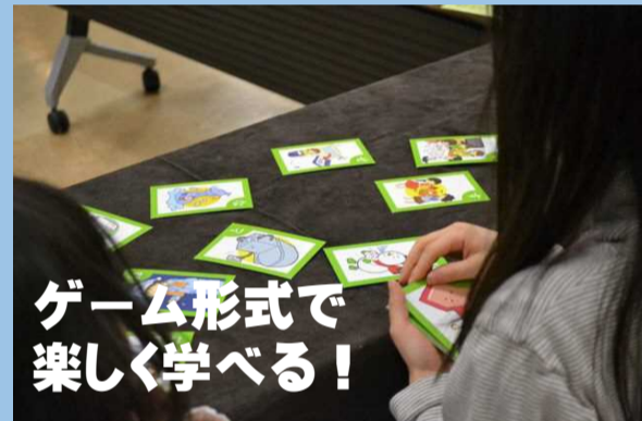
ゲーム形式で 楽しく学べる！