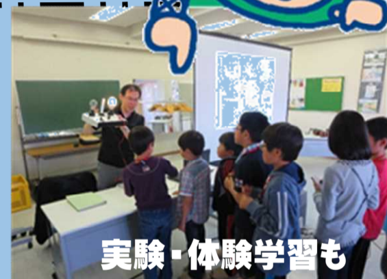
実験・体験学習も