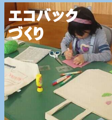
エコバック づくり